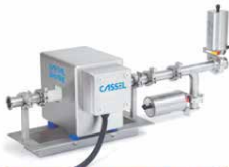
Detector de Metales para Producto Líquido