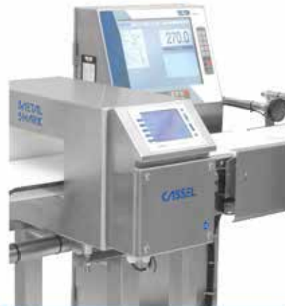
Detector de Metales + Checadora de Peso