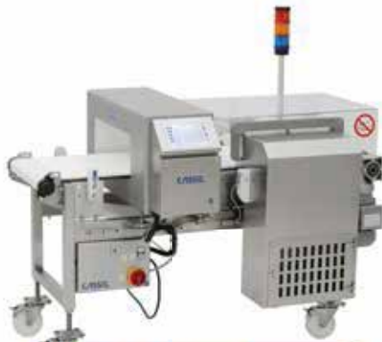
Detector de Metales para Producto Empacado