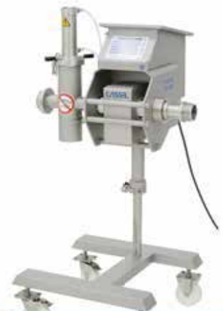
Detector de Metales para Embutidos