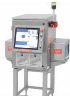
Inspección por Rayos X para producto líquido o en pasta