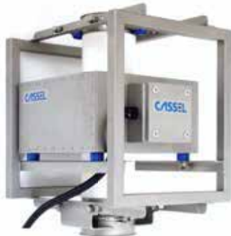
Detector de Metales Caída libre